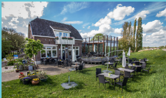
Het Veerhuis in Varik

Varik en Heesselt hebben een eigen website: www.varik.nl Daar kun je alles vinden over beide dorpen en ook het laatste nieuws en activiteiten. Ook over de geschiedenis van beide dorpen kun je daar veel vinden.