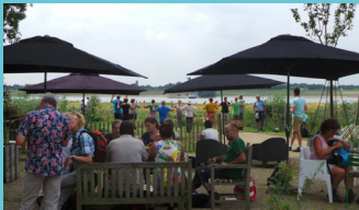
Theetuin River Lounge in Heesselt